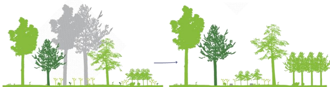
La futaie irrégulière : une coupe réalisée tous les 8 ans environ, pour amener progressivement la forêt vers un mélange équilibré d'arbres de différents âges et tailles.

Au contraire, l'objectif est qu'elles comportent à terme, une proportion équilibrée de jeunes semis, d'arbres adultes et de vieux arbres.